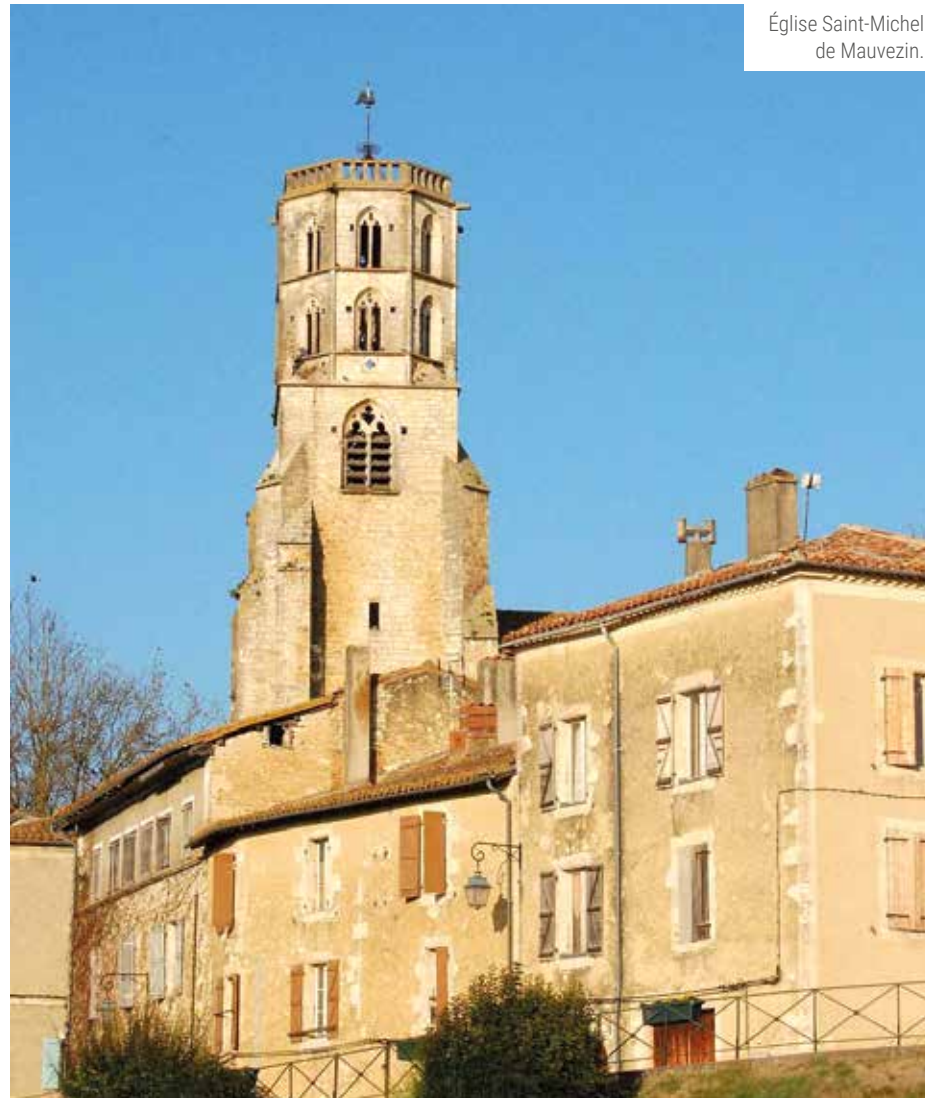
Église Saint-Michel de Mauvezin.

Chrétien au service de l'Église locale (étymologie du terme diaconat), qui a reçu