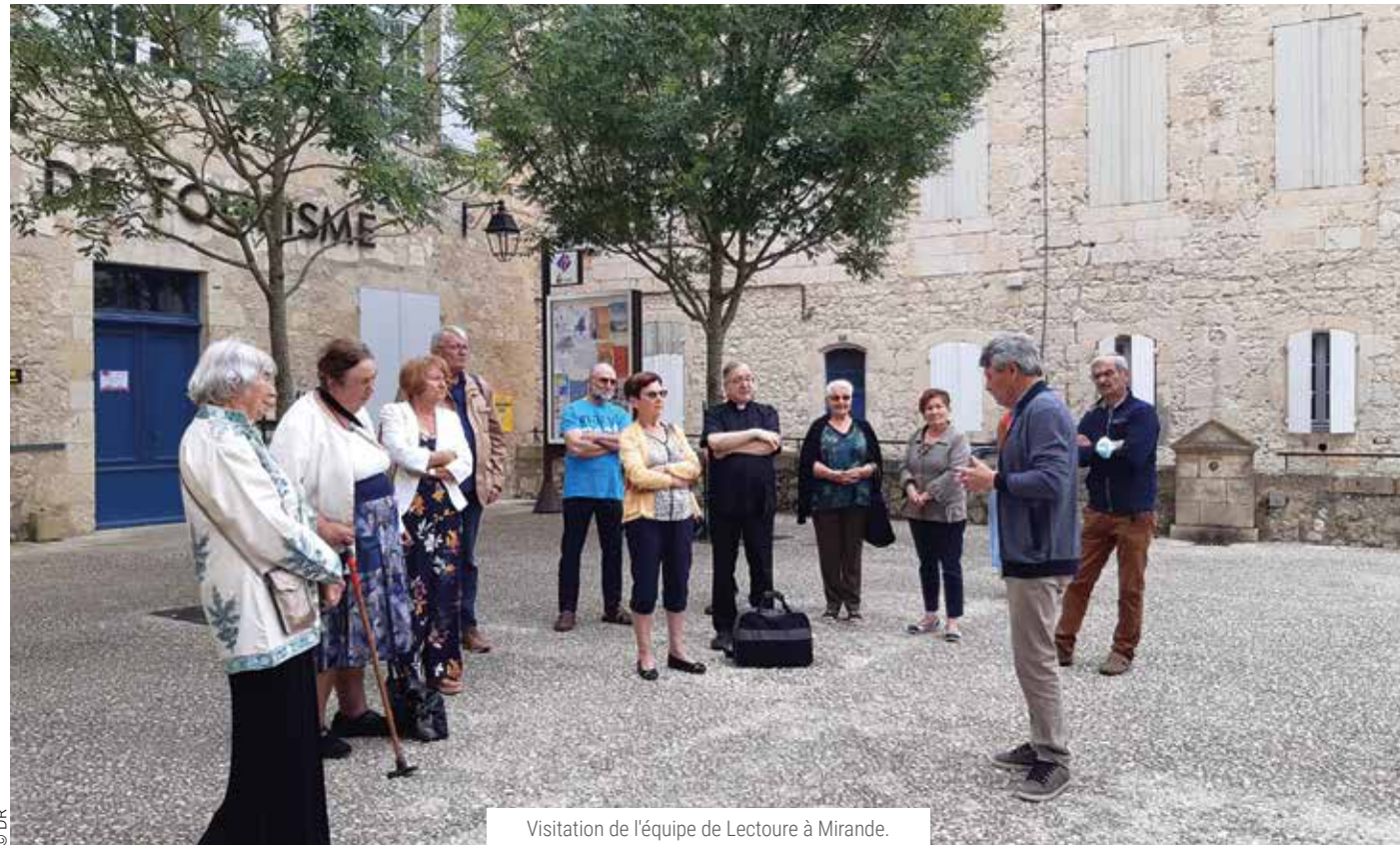
Visitation de l'équipe de Lectoure à Mirande.