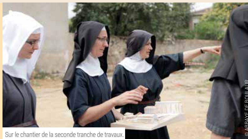
Sur le chantier de la seconde tranche de travaux.

Dans le domaine de l'écologie du paysage, la zone frontière entre deux écosystèmes s'appelle un écotone. Comme les rives d'un lac ou la lisière d'une forêt, cette zone est généralement très riche en biodiversité car elle abrite des espèces propres à ce milieu de transition, mais aussi des espèces appartenant