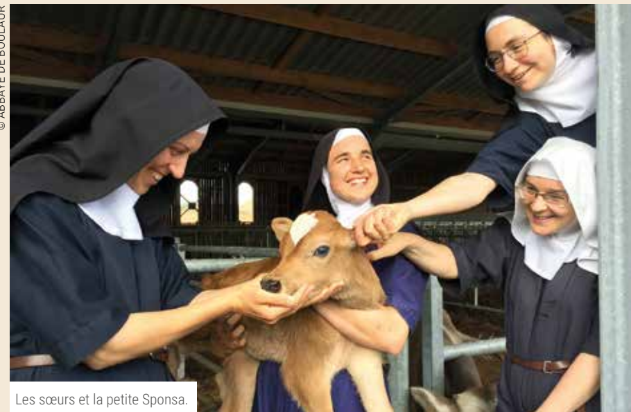
Les sœurs et la petite Sponsa.