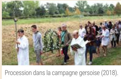
Procession dans la campagne gersoise (2018).

Les anciens se souviennent : les rogations, c'étaient des processions de printemps, par les fraîches matinées des trois jours précédant l'Ascension. Le curé, en soutane, surplis et barrette, accompagné d'enfants de chœur et de paroissiens assez nombreux, parcourait des chemins ruraux, de calvaires en croix de carrefours. Le chant des litanies ponctuait le trajet, et des prières avec aspersion d'eau bénite demandaient la protection de Dieu pour des moissons sans grêle et des récoltes abondantes. De telles pratiques ont continué après le concile Vatican II (1962-1966), mais certains trouvaient dépassées ces litanies demandant d'être délivrés « de la peste, de la famine et de la guerre », alors que l'agriculture parlait surtout « productivité ». L'Église avait-elle renoncé à cette pratique ? Dans la France de moins en moins rurale, il