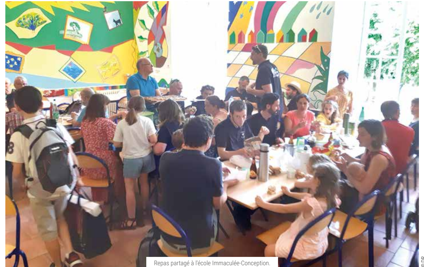
Repas partagé à l'école Immaculée-Conception.