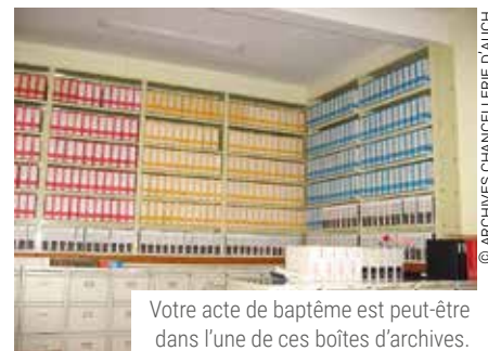
Votre acte de baptême est peut-être dans l'une de ces boîtes d'archives.

CONTACT : 13 RUE DR SAMALENS, 32000 AUCH. PRÉCISER SOIT CHANCELLERIE, SOIT BUREAU DES MARIAGES.