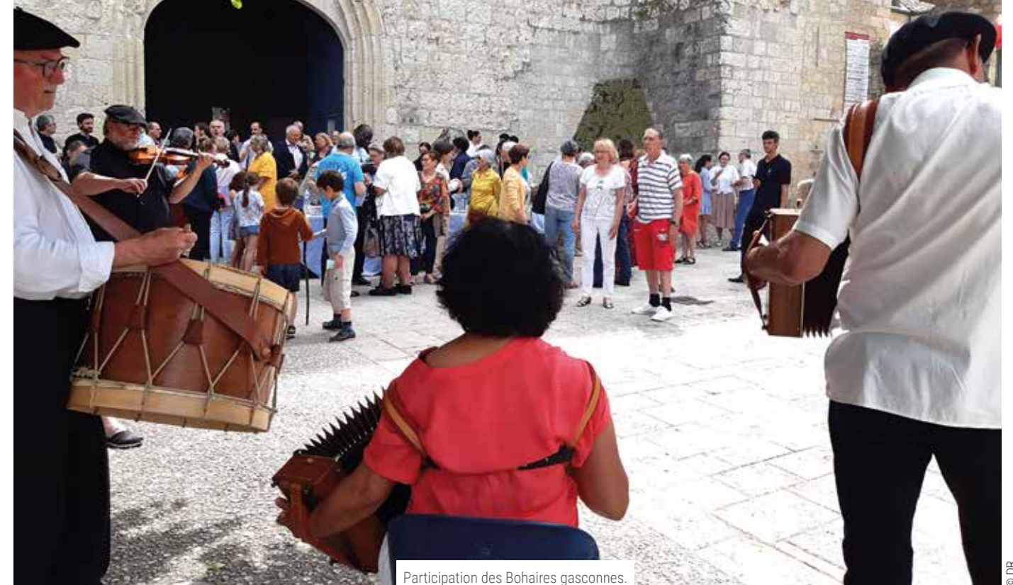
Participation des Bohaires gasconnes.