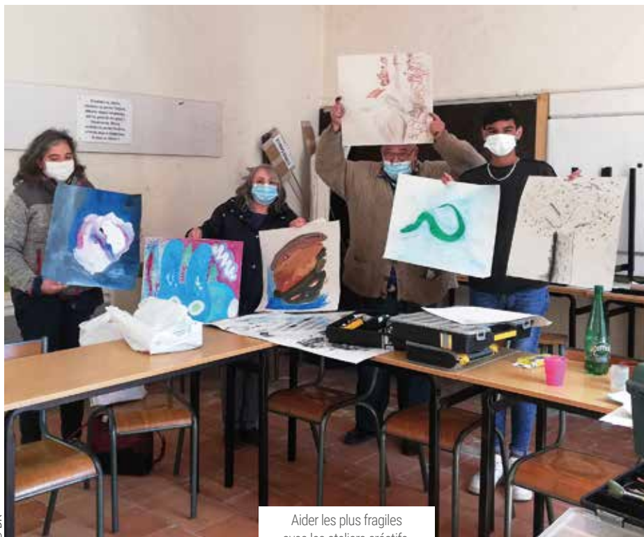
Aider les plus fragiles avec les ateliers créatifs.

Et, c'est ce qui a intéressé nos équipes de Saint-Vincent-de-Paul, de Gimont et