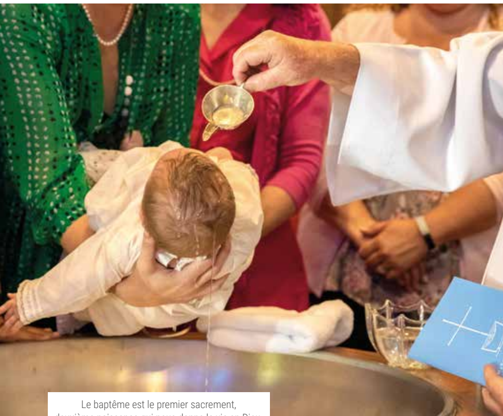
Le baptême est le premier sacrement, deuxième naissance qui nous donne la vie en Dieu.