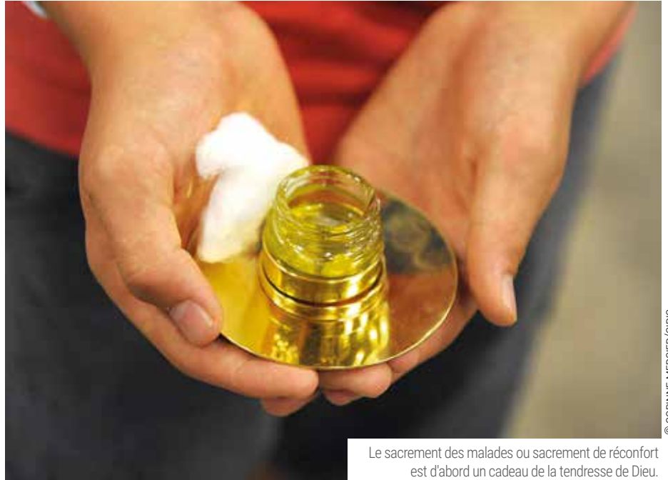
Le sacrement des malades ou sacrement de réconfort est d'abord un cadeau de la tendresse de Dieu.

« Dans le sacrement des malades, Jésus, tu me réconfortes. Tu as vécu toutes ces souffrances, psychologiques, morales, physiques, dans ta vie d'homme, dans ta Passion. J'ai confiance en toi, tu m'accompagnes au plus intime de ce que je vis depuis mon baptême. J'ai confiance en toi, Tu viens habiter ma fragilité, ma souffrance, ma maladie, Tu viens les vivre avec moi. Tu sais mon inquiétude, ma peur, ma révolte, mon refus, ma fermeture, ma résignation, ma soumission, ma tristesse; tu viens par ce sacrement me donner ton