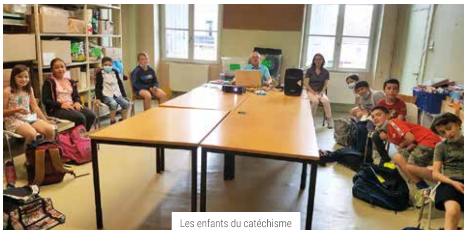
Les enfants du catéchisme

M ardi 1 er juin 2021 : dernière des quinze séances de catéchisme des CM1 à l'école Saint-Laurent, pour l'année scolaire 2020-2021. L'année, axée autour des thèmes du livre Promesse de Dieu : Dieu marche avec nous des éditions Bayard, a été consacrée à l'évocation, aux échanges, aux réponses et aux questions des enfants sur la Création, l'alliance de Dieu avec Abraham et Moïse, la vie de Jésus, sa sagesse, les manifestations de la puissance de Dieu (les miracles, le mystère de Lanciano...), l'abaissement de Jésus, Fils de Dieu, jusqu'à sa Passion, sa mort et sa résurrection, les témoins du Christ (sœur Emmanuelle, l'abbé Pierre, sainte Thérèse, Tim Guénard, Mickael Lonsdale, Albert Einstein, saint Paul, et aux chants (Glorius, Laurent Grybowski...), les périodes et les fêtes liturgiques (l'Avent,