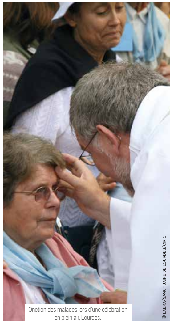
Onction des malades lors d'une célébration en plein air, Lourdes.

Il s'agit de ne pas culpabiliser, de ne pas chercher une cause à ses souffrances, mais de les accueillir pour obtenir la consolation de l'amour de Dieu.