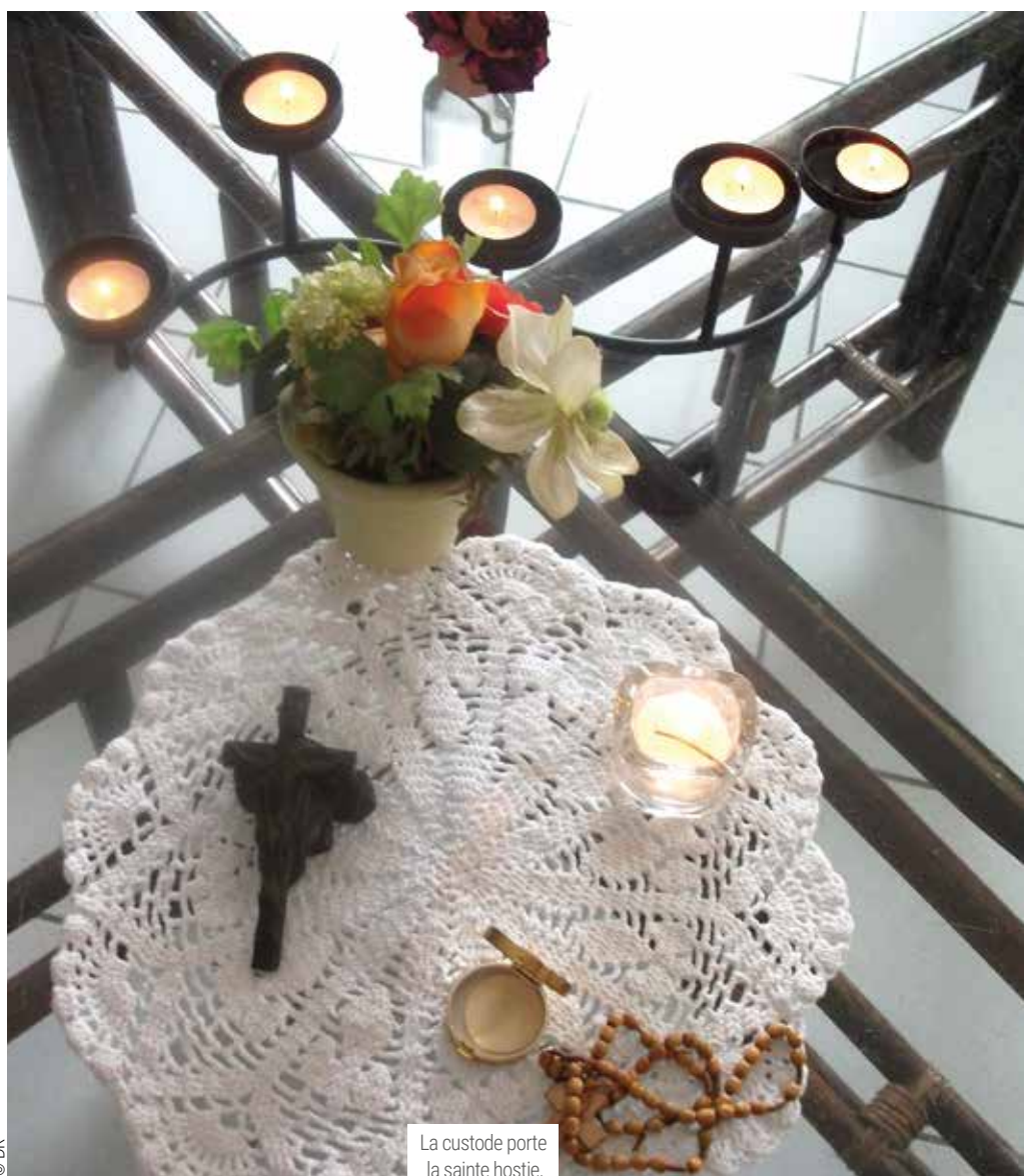
La custode porte la sainte hostie.