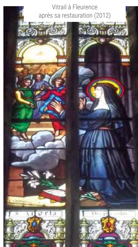
Vitrail à Fleurance après sa restauration (2012)

Ici, dans nos églises, les vitraux appartiennent au patrimoine du XIX e siècle dans leur majorité, certains jamais encore restaurés demandent un peu d'entretien. Quand le réseau de plomb ou le solin du calfeutrement de la fenêtre commence à s'altérer, une intervention rapide permet de limiter les dommages qui peuvent survenir par la suite: chutes et bris des verres peints, problèmes divers liés au fait que le vitrail ne soit plus une clôture étanche et que l'eau, le vent, les oiseaux, puissent pénétrer dans l'église ou que des micro-organismes tels que des algues,