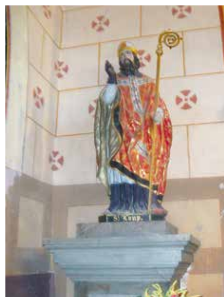
► Saint Loup, église de Saint-Créac.

Pierre, nommé Simon avant d'être surnommé « Pierre » (= le rocher) par le Christ, forme le groupe des douze. Jésus lui indique clairement sa mission : « Tu es Pierre et sur cette pierre je bâtirai mon église » (Mathieu 16, 13-19). L'activité de Pierre à Jérusalem, en Samarie, à Antioche et à Rome n'est pas freinée par ses arrestations successives. Son martyre sur la colline du Vatican, vers l'an 64 sous le règne de Néron et son inhumation sur place,