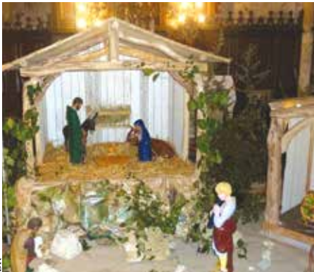
La crèche de Fleurance en 2019.

B ien sûr que oui ! Mais quel Noël ? Un Noël avec des lumières, de grandes festivités, beaucoup de cadeaux, des repas pantagruéliques ? Celui-là est peut-être à mettre aux ou-