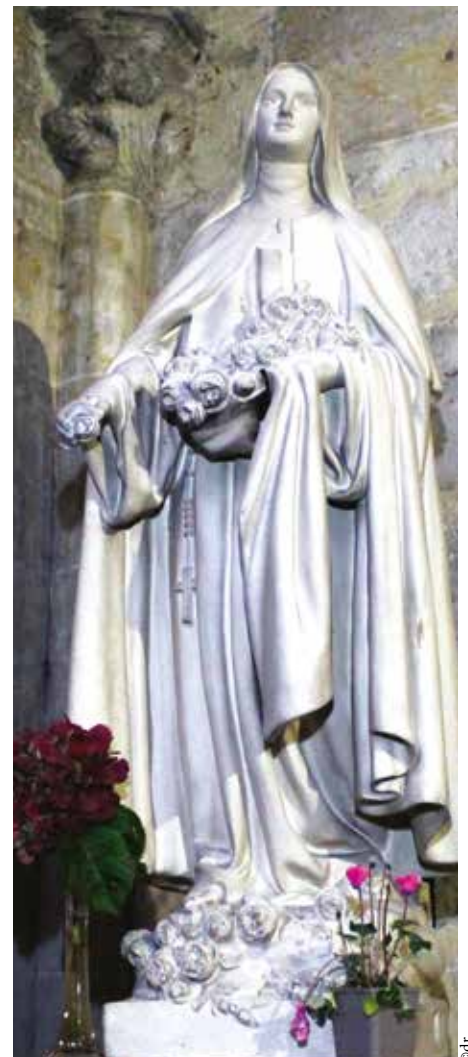
► Sainte Thérèse.

À l'époque préchrétienne, les païens célébraient des rites pour leurs défunts, après les dernières récoltes à la fin de l'automne. Ces coutumes ont probablement incité les chrétiens à en faire autant.