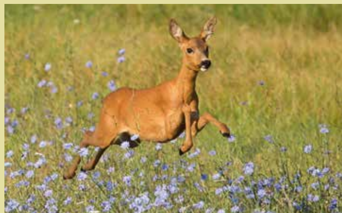
► Le chevreuil, une espèce particulièrement surveillée par la FDC32.