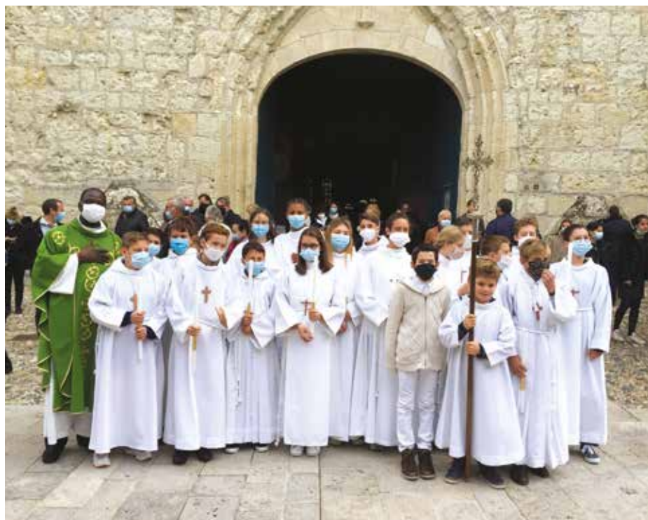
Profession de foi à la sortie de la messe.

Les professions de foi et la première communion, prévues au printemps, ont exceptionnellement eu lieu cet automne.