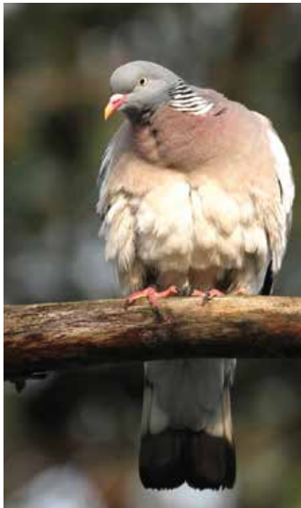
► Une palombe.

Oui, avec deux amis nous pratiquons cette chasse depuis plusieurs années. Dès le mois de mars nous aménageons la palombière et ses alentours. Il faut tailler les branches et entretenir le sol du couloir, s'occuper des appeaux.