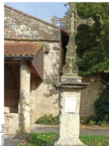
► Croix de mission à Pavie.

Il y en a sans doute plus. Elles font partie de notre paysage. Elles racontent aussi un pan de notre histoire. Elles sont un patrimoine à protéger.