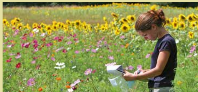
► La FDC32 accompagne les sociétés de chasse sur les actions d'aménagement de terrain comme la plantation de jachères.