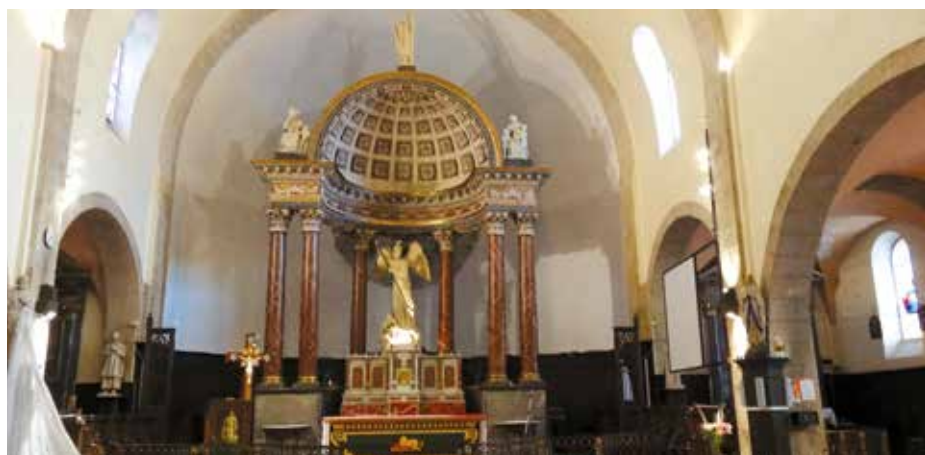
Le chœur de l'église de Mauvezin.