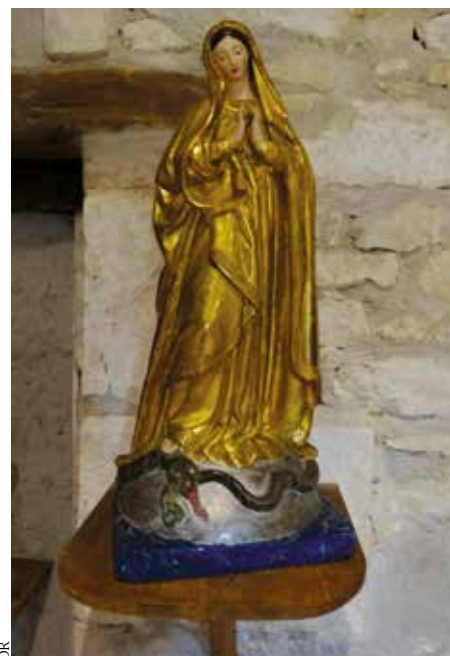
Statue de la Vierge, chapelle.

port de prière et de partage pendant le temps que nous passons ensemble : de 15 h 30 à 16 h 30 environ. Nous allons de maison en maison et c'est toujours une joie de se retrouver et d'échanger ensemble, autour de l'Évangile et également à partir d'une question qui nous renvoie à notre expérience de foi. Chacune est libre de s'exprimer ou pas. Ce partage de vie et de foi constitue une nourriture qui nous aide dans notre vie, bien au-delà de cette rencontre mensuelle. Il y aurait encore beaucoup d'autres choses à dire sur ces Équipes du Rosaire... N'hésitez pas à venir nous rejoindre afin que nous offrions ensemble vos joies et partageons vos peines, nous vous accueillons avec plaisir. Une heure par mois. Un temps de convivialité, d'échanges, de prière et de rencontres amicales. Pourquoi pas vous ?